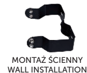
MONTAŻ ŚCIENNY WALL INSTALLATION